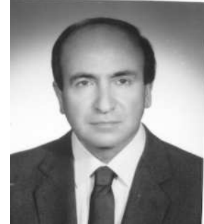
TUNCER TOPUR E. Büyükelçi